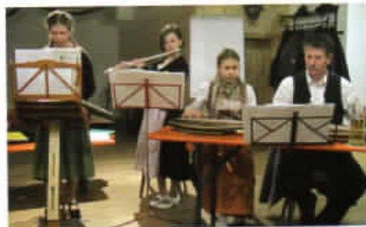
Hoagarten („D' Innviertler“)