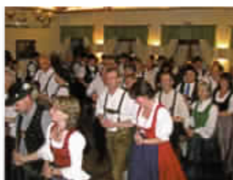
Kathreintanz und Volkstanz- übungsabende