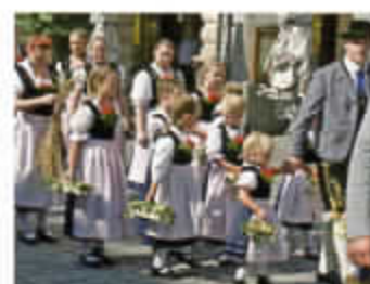
Teilnahme am Erntedankgottesdienst