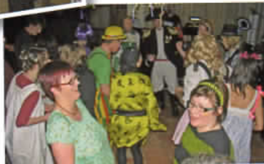
Faschingskranz („D' Innviertler“)