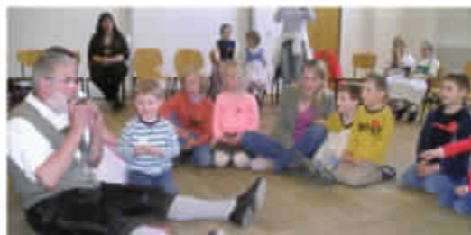
„Sepp, Depp, Hennadreck“ – lustige Kindernachmittage („D' Innviertler“)