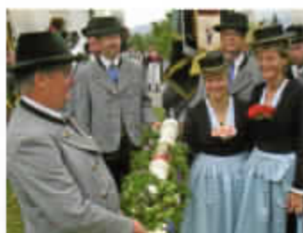
Teilnahme an Gauwallfahrt Schwarzläck