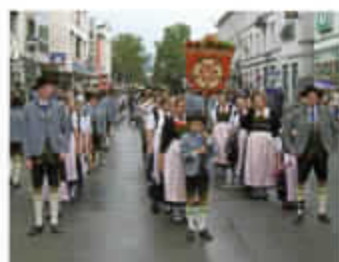
Teilnahme am Herbstfesteinzug