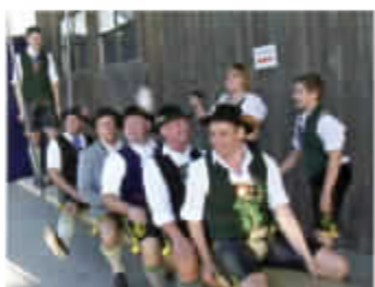
Kirtahutschn („Alt Rosenheim“)