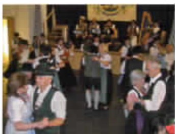
Tanz in den Mai im Saal des Künstlerhofes („D' Innviertler“)

Trachtenjahrtag zum Gedenken der gefallenen und verstorbenen Trachtler (im Wechsel „Alt Rosenheim“, „D' Innviertler“ und „Stamm I“)