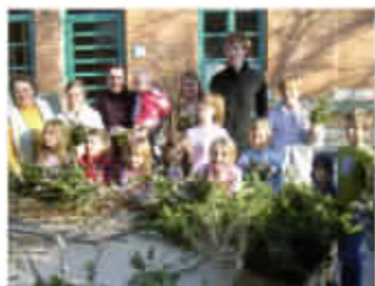
Palmbuschnbinden („Alt Rosenheim“)