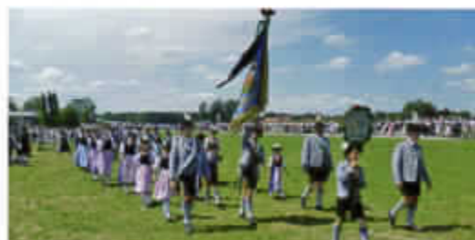
Teilnahme an Trachtenfesten mit Ausflügen