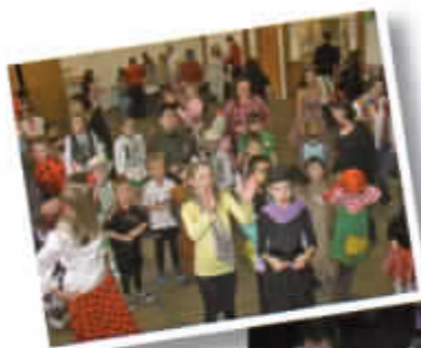
„Alt-Mang-Viertler-Kinderfasching“ (im Wechsel „Alt Rosenheim“, „D' Innviertler“ und „Mangfalltaler“ Kolbermoor)

In alter Tradition werden die Weihnachtsfeiern unserer Vereine von der Kinder- und Jugendgruppe gestaltet. Alle sind mit Freude dabei, Hirtenspiele und Gedichte in Mundart einzustudieren oder am Programm mit Musikstücken und Liedern mitzuwirken.